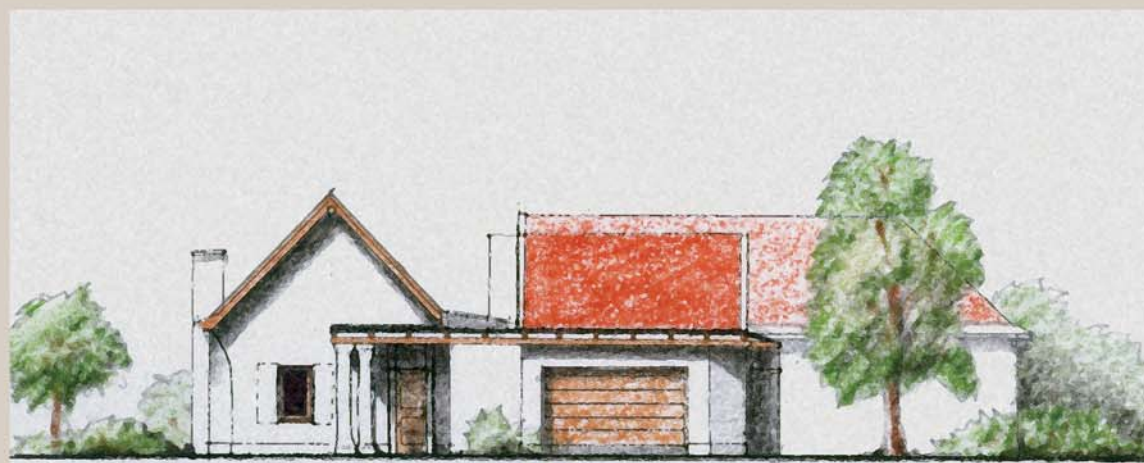
utcai homlokzat m=1:200