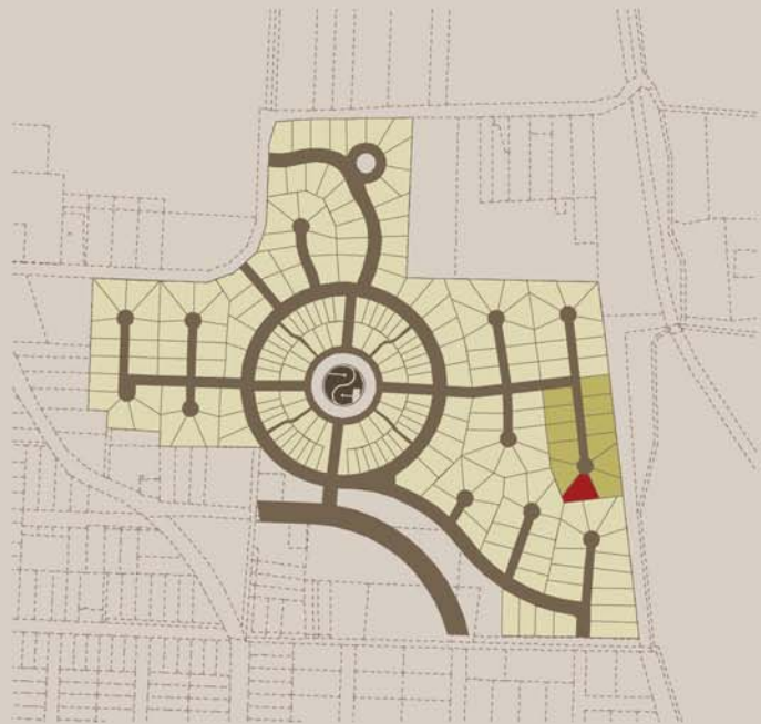
helyszín - m 1:10000