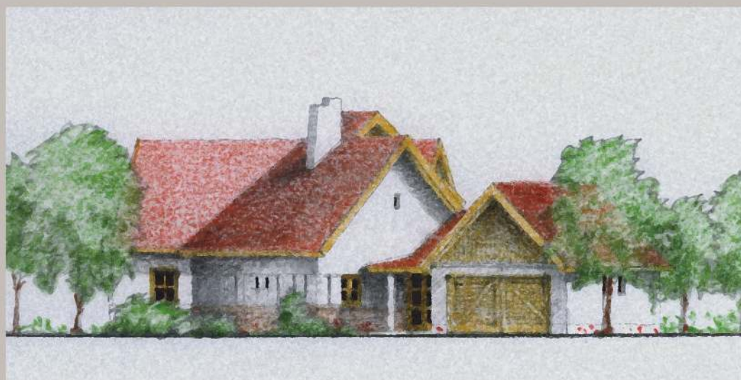
utcai homlokzat m=1:200