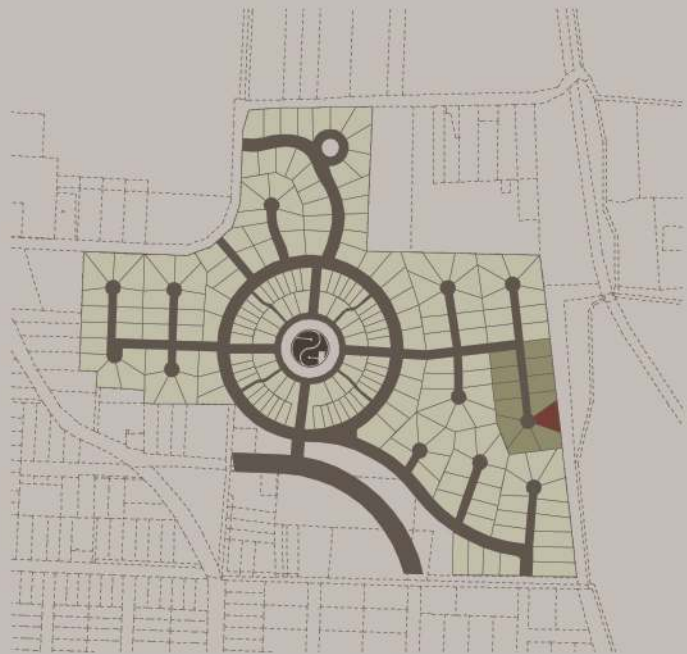
helyszín - m 1:10000