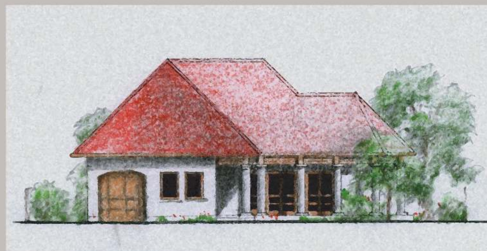
utcai homlokzat m=1:200