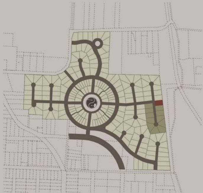
helyszín - m 1:10000